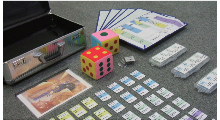
ワークブック(テキスト)